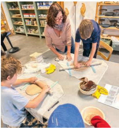
Grenzenlose Kreativität wie zum Beispiel beim Töpfern