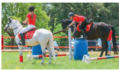
Geschick ist gefragt

Samstag, 20. Juni, 8 Uhr Parkplatz Horneingang, Schwabenberg, Gebenstorf