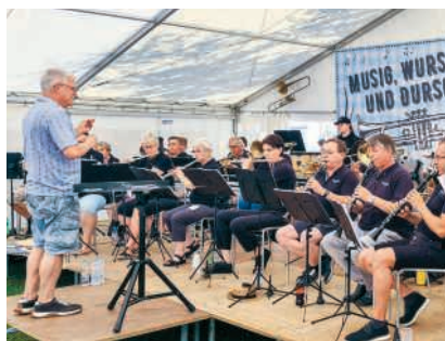
Harmonie Turgi Gebenstorf: Musig, Wurscht und Durscht

Das Festzelt öffnet um 11 Uhr, um 11.30 Uhr beginnt das Frühschoppenkonzert der Gastgeberformation. Am Nachmittag sorgen die Jugendmusik Allegro Region Baden sowie der Musikverein Buchs ZH für musikalische Unterhaltung. In den Pausen spielt das Duo Hafner. Den Abschluss bildet ein gemeinsames Finale am Abend.