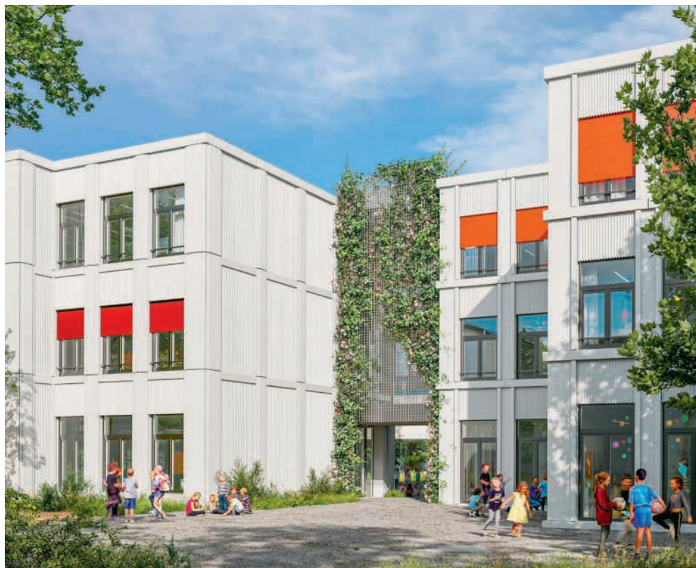
Mehr Schulraum für Gebenstorf

Im Aussenraum sind ebenfalls Anpassungen vorgesehen. Die bestehenden Pausenflä-