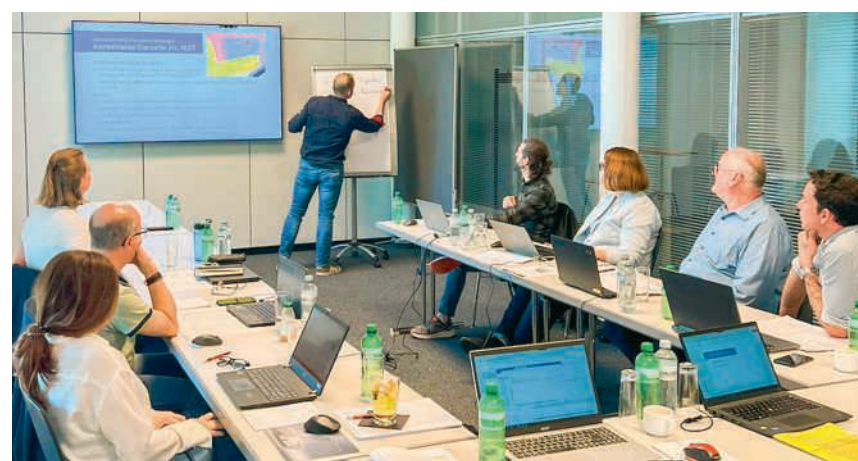
Die Teilnehmerinnen und Teilnehmer des Workshops beraten die strategische Entwicklung der gemeindeeigenen Liegenschaften

Das Untere Schulhaus mit den Tagesstrukturen sowie das Obere Schulhaus, das als Schulraumreserve und für befristete Zwischennutzun-