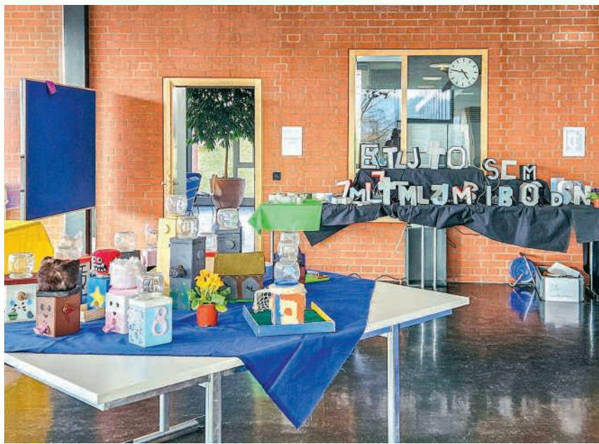
Werk- und Zeichenausstellung

In der Projektwoche arbeitete die Klasse gemeinsam an einer eigenen