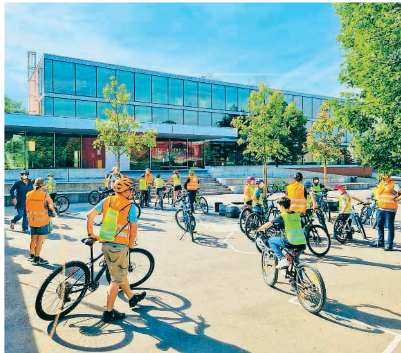
Abwechslungsreiches Velotraining für die Jugendlichen

Praktisch wurde es anschliessend für 18 Schülerinnen und Schüler der 5. Klasse. Unter der Leitung von Pro Velo, organisiert von der Elterngruppe Gebenstorf und finanziell