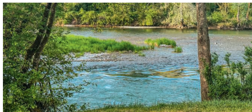
Am Ufer des Limmatspitz kann man es sich gemütlich machen

Ein grosses Dankeschön gilt allen Organisationen, Helferinnen und Helfern, die mit ihrem Einsatz dazu beigetragen haben, den Schulweg in Gebenstorf ein Stück sicherer zu machen.