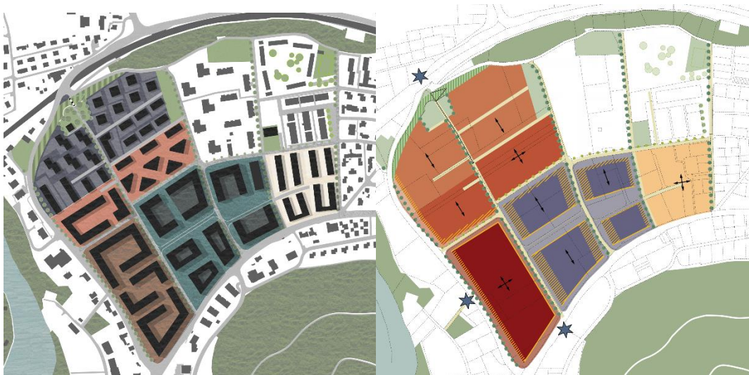
Ausschnitt aus dem ERP Geelig

Als erster Schritt der Gebietsentwicklung wurde im Jahr 2018 ein Räumliches Entwicklungskonzept (REK) erstellt, das die Potenziale des Gebiets bis zum Jahr 2040 aufzeigt – insbesondere im Bereich der ehemaligen Kiesgrube. Die daraus gewonnenen Erkenntnisse flossen in den kommunalen Entwicklungsrichtplan (ERP) ein, der insbesondere die Abstimmung zwischen Siedlungsentwicklung und Verkehr vertieft. Der im Februar 2023 behördenverbindlich verabschiedete ERP weist für das Gebiet Geelig ein Entwicklungspotenzial von rund 2'500 bis 3'000 neuen Einwohnerinnen und Einwohnern aus.